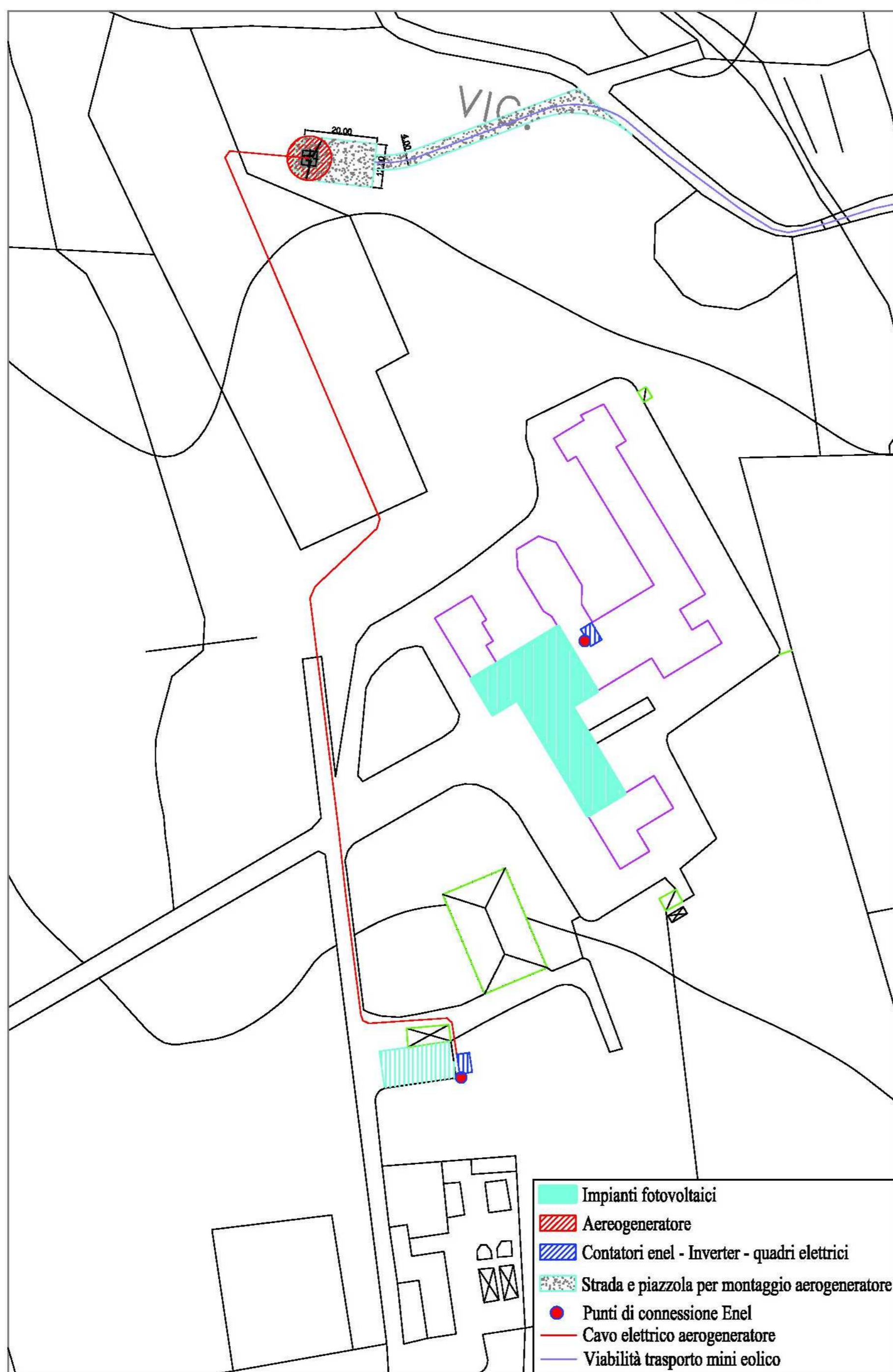
Stralcio Aereofotogrammetrico Scala 1:1000